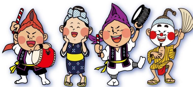
エイサーのまち沖縄市PRキャラクター